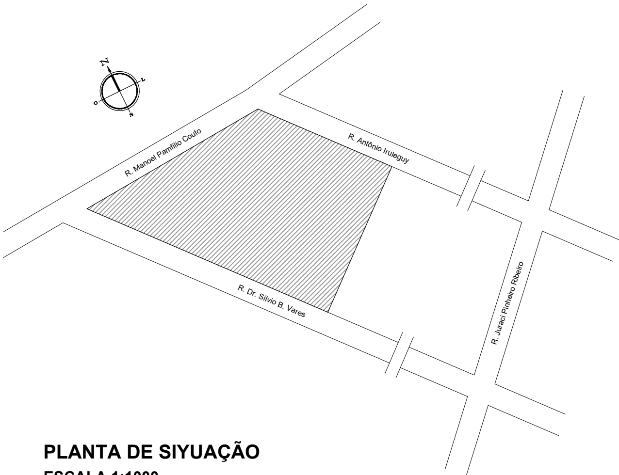
PLANTA DE SIYUAÇÃO ESCALA 1:1000